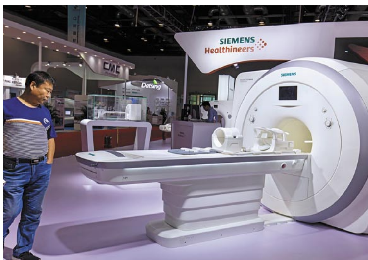
Siemens Healthineers muss in den USA unerwartete Zinskosten in Höhe von 20 Mio Euro verkraften.

Kurzfristig müssen sich die Anleger vor allem auf weitere negative Dollar-Effekte einstellen. Finanzchef Jochen Schmitz stuft sie auch im vierten Quartal als erheblich ein. Von April bis Juni hatten sie die Marge um 140 Basispunkte gedrückt. Weitere 70 bis 80 Basispunkte kostete ein Automatisierungsauftrag für