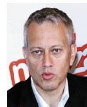
Quincey: „Keine Wahl.“

In den USA schossen die Stahl- und Aluminiumpreise seit Jahresbeginn um 33 beziehungsweise 11% nach oben. Da wirken sich die von Präsident Donald Trump verhängten Strafzölle aus. Dazu kommen jetzt noch die nur gegen China gerichteten Zölle, was die Kosten für Firmen erhöht, die Komponenten aus dem