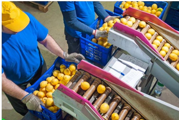
Die meisten Betriebe können aufgrund ihrer geringen Größe nicht in die Produktionssteigerung investieren.

Etwa 92% der Firmen im Lebensmittelsektor sind sehr kleine Familienbetriebe mit bis zu neun Mitarbeitern, die nur rund ein Fünftel des Gesamtumsatzes erwirtschaften. Dagegen entfallen auf 1% der Unternehmen fast zwei Drittel des Branchenumsatzes. Bei letzteren handelt es sich nach griechischen Maßstä-