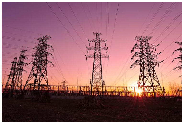
Auf der Liste der Regierung stehen mehrere große Energieunternehmen, die in private Hände übergehen sollen.

woblenergo, Chmelnyzkoblenergo und Cherson Heizkraftwerk, im Bereich des Maschinenbaus Turbotom, Elec-trotyazhmash und Dni-provsky Electric Locomotive Plant, in der chemischen Industrie Sumyk-