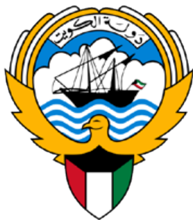
Ministry of Commerce and Industry of the State of Kuwait

Робоча мова форуму – англійська (переклад українською).